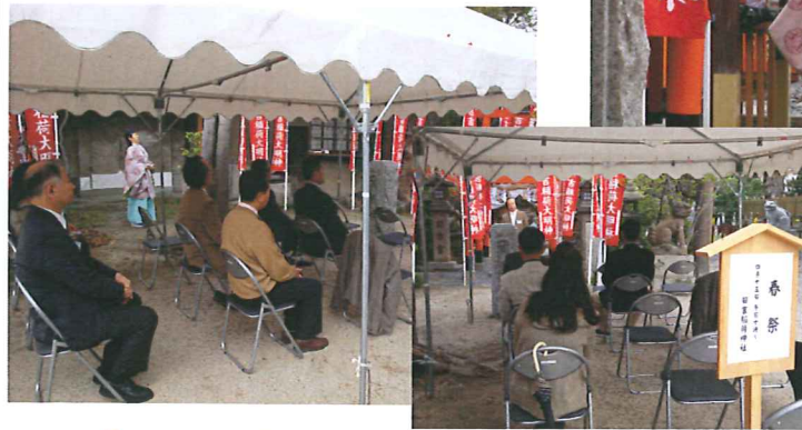
↑ 日吉稻荷神社にて

今年も昨年に引き続き当神社末社である日吉稻荷神社例祭「春祭」が、4月15日に開催されました。総代を中心に、今年も天候に恵まれ、実り多い年であるよう、皆で祈りました。