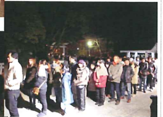
↑ 例年通りの長い行列