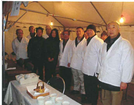
↑ お手伝いの総代の皆さん