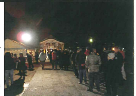
↑例年通りの長い行列

毎年2月立春前日に齋行されます。冬と春との季節の分かれ目に行われるこの節分祭には、除疫・招福が祈願されます。当神社では、朝9時より参詣の皆様方に、総代初め崇敬者のご奉仕により、お神酒と大根炊きのご接待をさせて頂きました。