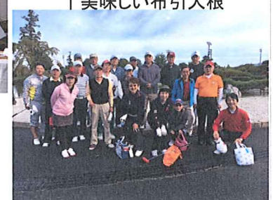
↑昨年秋のコンペにて

5月23日(水)於聖丘CC 東コース 9:59ST プレー費 10,750円(セルフ・昼食込)会費別途 締切4月中旬 6組募集中 是非ご参加下さい。