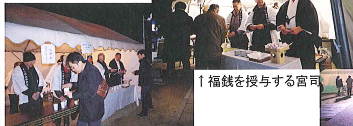
↑福銭を授与する宮司