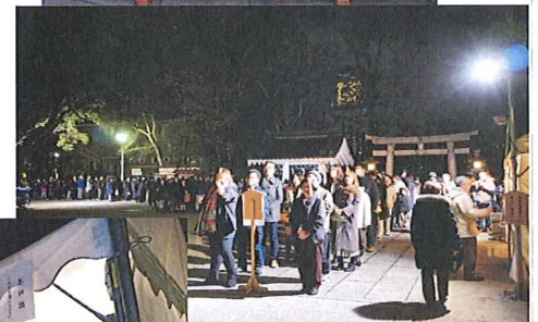
↑鳥居まで続く行列