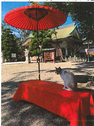
写真スポットあります↑

七五三(しちごさん)とは、7歳、5歳、3歳の子供の成長を祝う日本の年中行事です。天和元年11月15日(1681年12月24日)に館林城主である徳川徳松(江戸幕府第5代将軍である徳川綱吉の長男)の健康を祈って始まったとされる説が有力です。今年満2才の男女、4才の男の子、6才の女の子の保護者の方は、当地の氏神様の当神社に是非ご予約の上、ご家族揃ってお参り下さい。